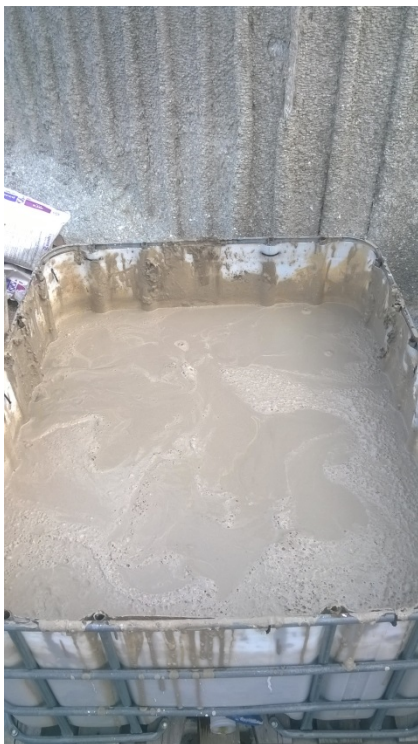
Fig. 1 Campione di fango (0.4 m 3 )