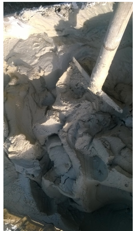
Fig. 3 Aspetto dopo 2 ore