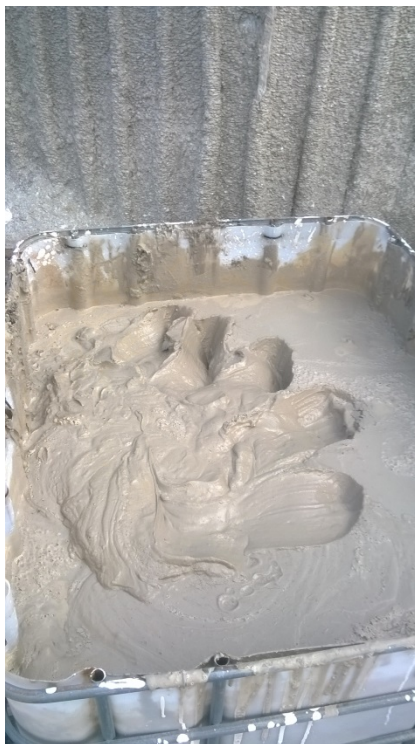
Fig. 2 Aspetto dopo l'aggiunta di 75 kg di i.speed ALI FLASH (20 min)