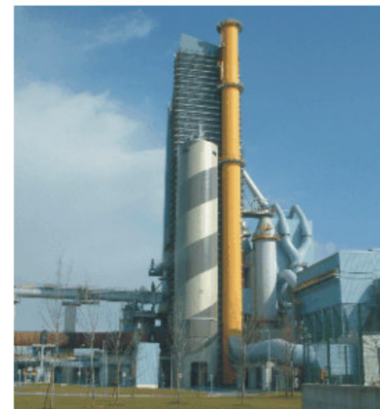
Cementeria di Calusco d'Adda (Bg)