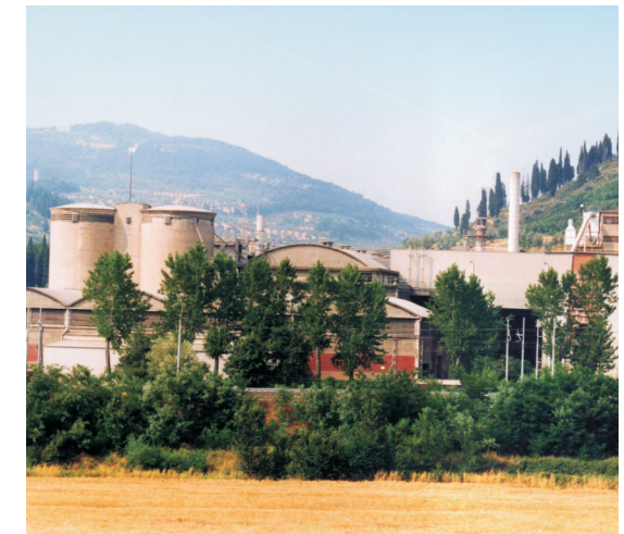
Cementeria di Pontassieve (Fi)