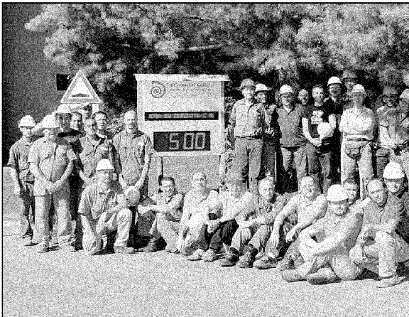
Alcuni lavoratori posano per una foto ricordo davanti al cartello che conta i 500 giorni senza infortuni all'Italcementi di Calusco d'Adda